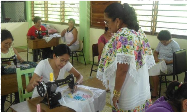
Bordado a Máquina (Tixpeual)

Este seguimiento se realizó personalmente por los integrantes del proyecto