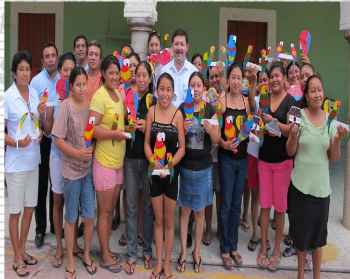
Artesanías de Madera (Tetiz)