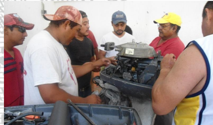
Reparación de Motores Fuera de Borda (Celestún)