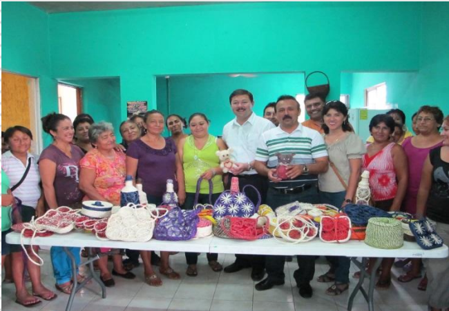
Artesanías de Henequén (Dzidzantun)