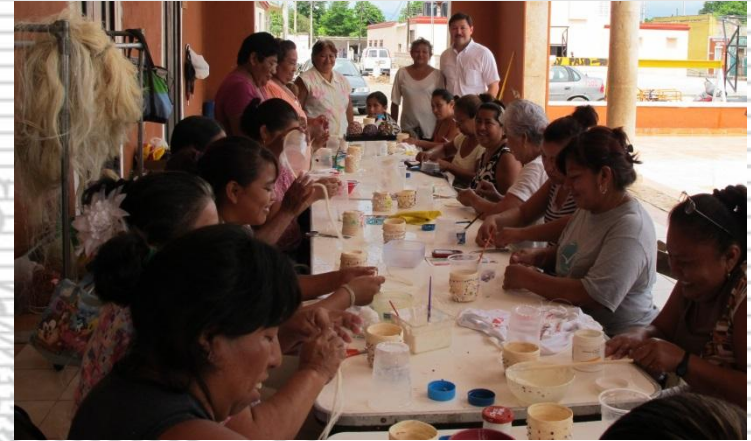
Artesanías de Henequén (Dzemul)